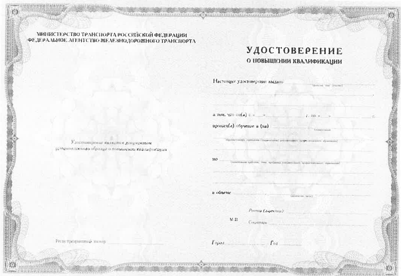
Рисунок 1 – Образец бланка удостоверения о повышении квалификации